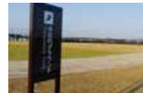
多功能運動場 排水性佳的田賽場與天然草坪的徑賽內場

【多功能運動場】(相當於) 1 圈 400m×4 條 / 土質鋪面田賽場 / 天然草坪的徑賽內場 【傾斜跑道】平緩的天然草坪與全天候鋪面跑道 (115m×2 條) / 100m 間高低差 2m 【沙坑跑道】全長 100m、寬 4m、深約 0.5m 的跑道 【環形跑道】1 圈約 900m