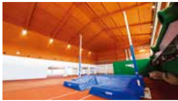
室內競技場 撐竿跳 可用於撐竿跳的屋頂高度(10m)