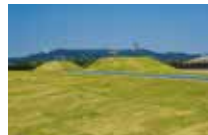
上下坡道 天然草坪的平緩跑道