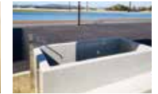
冷水浴 運動過後的緩和設備

【其他設備】浴室 / 淋浴間 / 三溫暖 / 製冰機 / 冷水浴 / 教練室 / 教練專用床 / 換尿布間 / 多用途大廳 / 輪椅可用於淋浴間 / 置物櫃室 / 拉筋室等 【體育館】籃球：2 面 / 排球：1 面 / 桌球桌：2 面