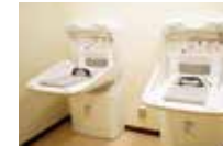
換尿布間 讓媽媽運動員也放心