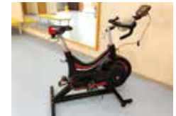
無氧動力量測用肌肉計