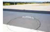
帶有屋頂的投擲場 可用於帕運會陸上競技

設有可同時練習多種項目，全國罕見的投擲練習場。提供投擲隊伍可專心練習的環境，亦是本中心的一大特色。此外，投擲練習場設有可供帕運會陸上競技選手訓練的投擲台、固定輪椅的設備。體育館內還可從事籃球、排球、桌球等休閒。