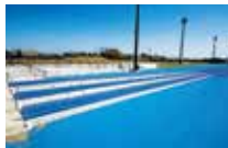
傾斜跑道 (全天候鋪面) 角度相異的 3 條傾斜跑道

多功能運動場可用於多人數的集訓。可活用天然草坪與全天候鋪面的平緩傾斜跑道，以及全長 100m 的沙坑跑道，組合多樣化的練習內容。