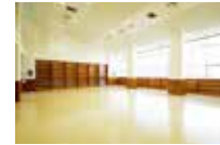
多用途大廳 挑高的開放空間

免費開放的環形跑道可作維持健康的場地利用。環形跑道沿線還設有緩和用的冷水浴。此外，管理大樓不僅備有浴室、淋浴間與三溫暖，還設有多用途大廳、製冰機、拉筋室、兼備教練專用床的教練室等完善設施。採用支援偕同幼小孩童或身障者的無障礙設計，志在提供舒適的訓練環境。