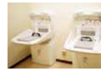
换尿布间 让妈妈运动员也放心