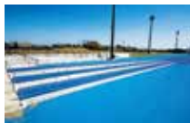
倾斜跑道(全天候型铺面) 角度不同的3条倾斜跑道

多功能运动场可用于多人数的集训。可灵活利用天然草坪与全天候型铺面的平缓倾斜跑道，以及全长100m的沙坑跑道，组合多样化的练习内容。