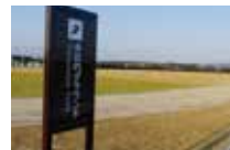
多功能运动场 排水性佳的田赛场与天然草坪的径赛内场

【多功能运动场】(相当于)1圈400m×4条/土质铺面田赛场/天然草坪的径赛内场 【倾斜跑道】平缓的天然草坪与全天候型铺面跑道(115m×2条)/100m间高低差2m 【沙坑跑道】全长100m、宽4m、深约0.5m的跑道 【环形跑道】1圈约900m