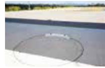
带有屋顶的投掷场 可用于残奥会上竞技