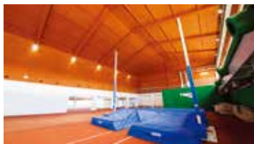
室内竞技场 撑竿跳 可用于撑竿跳的屋顶高度(10m)