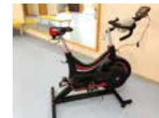
无氧动力测量用肌肉计