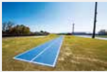
7 倾斜跑道 (2条全天候型铺面跑道)