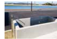
冷水浴 运动过后的缓和和设备

【其他设备】浴室/淋浴间/桑拿/制冰机/冷水浴/教练室/教练专用床/换尿布间/多功能大厅/轮椅可进的淋浴间/置物柜室/拉筋室等 【体育馆】篮球：2面/排球：1面/桌球桌：2面