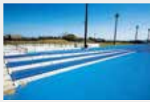
5 倾斜跑道 (陆上竞技场内)