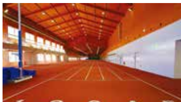
室内竞技场 直线跑道 国内最长150m×5条直线跑道

【陆上竞技场】日本陆连第3种公认陆上竞技场(2019/4/1~) / 1圈400m×8条 / 全天候型铺面径赛场 / 天然草坪田赛内场 / 倾斜跑道(全天候型铺面: 约40m×3条(不同的倾斜角度) / 夜间照明设备 等 【室内竞技场】日本陆连公认陆上竞技场(2019/4/1~) / 150m×5条 / 全天候型铺面的直线跑道 / 跳远、三级跳用的助跑跑道及沙坑 1处 / 撑竿跳海绵垫 1处(可用于撑竿跳的屋顶高度10m) / 营运室 / 照片判定装置、播音设备 / 空调设备 等