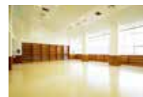
多目的ホール 天井が高く開放感のあるスペース

どなたでも無料でご利用いただける周回走路は、健康づくりの場としてもご活用頂けます。周回走路沿いにはクールダウン用のアイシングバスを備え、また管理棟には浴室やシャワールーム、サウナはもちろん、開放感のある多目的ホールや、製氷機、ストレッチルーム、トレーナー用ベッドも備えたトレーナールームなども完備。また、小さなお子さん連れや、身体障がい者に対応したバリアフリーな設計で、快適なトレーニング環境を目指しています。