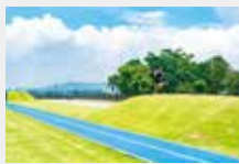
8 アップダウンヒル