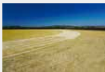
2 多目的グラウンド