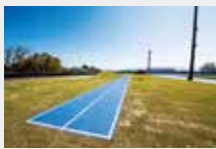
7 傾斜走路 (全天候舗装2レーン)