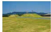
アップダウンヒル 天然芝の緩やかな走路