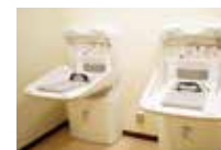
おむつ換えコーナー ママさんアスリートも安心