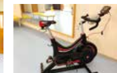
無酸素パワー測定用エルゴメーター