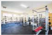
11 トレーニングルーム