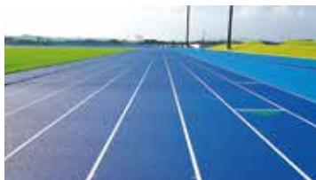
陸上競技場 ブルーの全天候舗装トラック(1周400m×8レーン)

鹿児島県の温暖な気候と、大隅の自然の中に広がる日本陸連第3種公認陸上競技場は、ブルーの全天候舗装の8レーン。近隣の「くにの松原」クロスカンントリーコース(1km・2km)と併せて、活用することで、充実した合宿計画を可能にします。また、天候を気にせずトレーニングすることができる冷暖房完備の室内競技場は、全天候舗装の150m×5レーンの日本陸連公認施設。150m直走路は、国内トップクラスで、オールシーズン快適な練習空間を提供します。走幅跳、三段跳、棒高跳にも対応しており、トラック競技、フィールド競技を問わず、トレーニングメニューの可能性が格段に広がります。