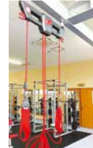
レッドコードトレーナー

トレッドミル:2台 / エアロバイク:2台 無酸素パワー測定用エルゴメーター:2台 空気抵抗方式エルゴメーター:2台 筋力系トレーニングマシン:1式(チェストプレス、シーテッド・ロー、ショルダープレス、ラットプルダウン、レッグエクステンション、レッグカール、レッグプレス、45°レッグプレス、ロータリートーン、トータルヒップ、プリーマージン) フリーウェイト:1式(パワーラック、スミスマシン、ダンベルセット)等