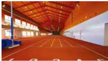
室内競技場 直走路 国内最長150m×5レーンの直走路

【陸上競技場】日本陸連第3種公認陸上競技場(H31.4.1~) / 1周400m×8レーン / 全天候舗装トラック / 天然芝のインフィールド / 傾斜走路(全天候舗装):40m程度×3レーン(異なる傾斜角度) / 夜間照明設備 等 【室内競技場】日本陸連公認室内競技場(H31.4.1~) / 150m×5レーン / 全天候舗装の直走路 / 走幅跳、三段跳用の助走路及び砂場:1箇所 / 棒高跳ビット:1箇所(棒高跳びに対応可能な天井高10m) / 運営室 / 写真判定装置・放送設備 / 空調設備 等