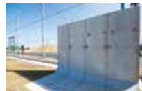
トレーニング用 ウォール 補強トレーニング用の壁