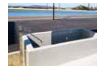
アイシングバス クールダウンに備えた設備

【その他の設備】浴室 / シャワールーム / サウナ / 製氷機 / アイシングバス / トレーナー用ルーム / トレーナー用ベッド / おむつ換えコーナー / 多目的ホール / 車椅子対応シャワー室 / ロッカー室 / ストレッチ室等 【体育館】バスケットボール:2面 / バレーボール:1面 / 卓球台:2台